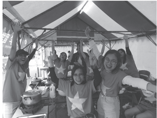
← Chúng tôi là du học sinh tại asahi. 訳：「私たちは朝日大学の学生です。」