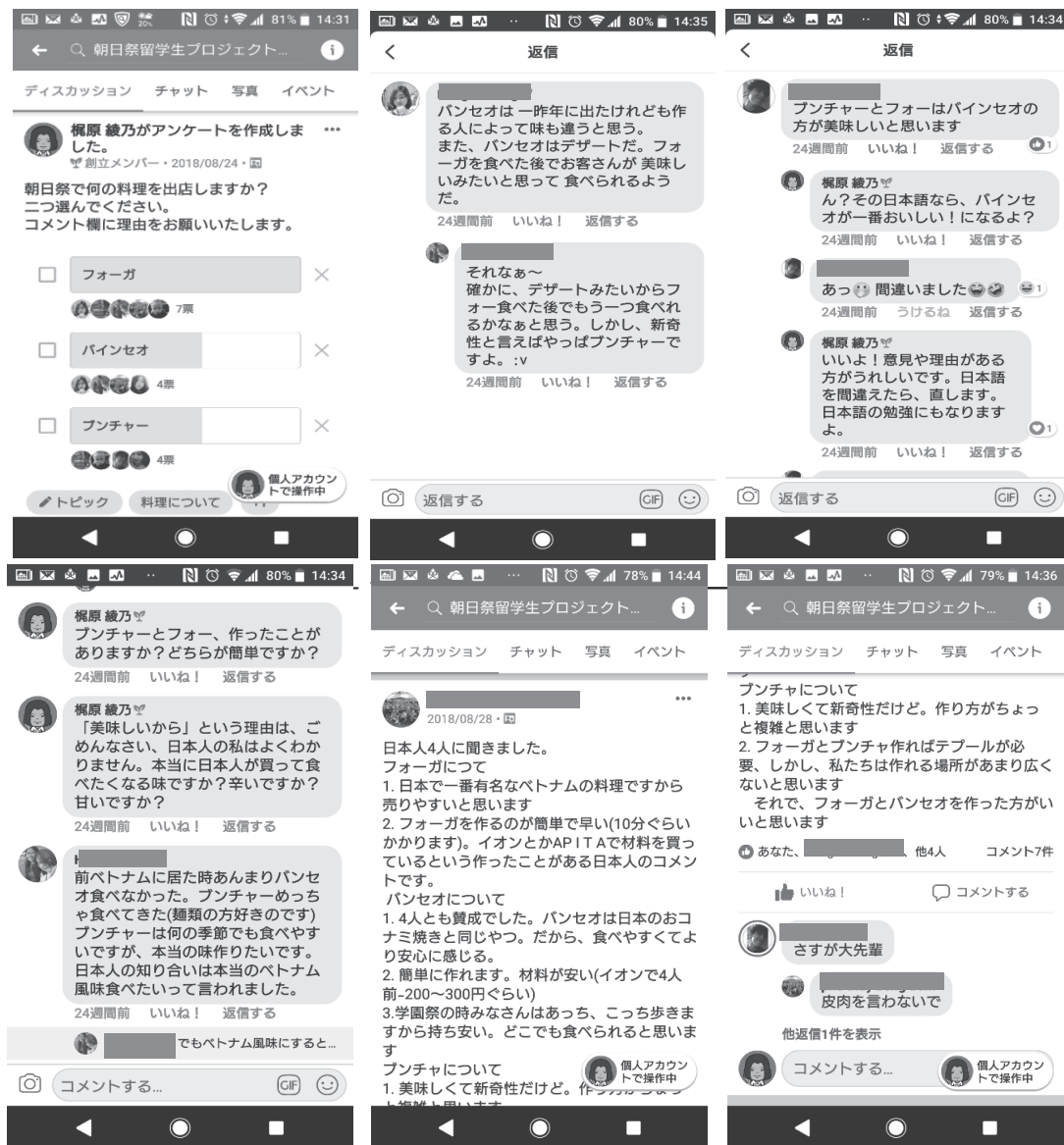
図1 メニューに関する議論と意見 (トピック④⑥の一部)