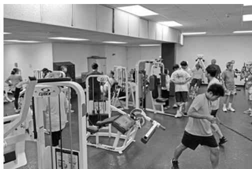
図5：授業風景2 (Adapted and Prescribed Exercise)

学生交流では、これもKRSプログラムでは初の試みである学生証(ID)の発行及び、レクリエーションセンターの利用が大きな役割を果たしていた。特に、レクリエーションセンターの利用については、授業内では学生と交流を持っても授業が終了すると、次の授業がある為なかなか次の接点作りが作りにくい場面があったと思うが、授業終了後に研修参加学生はレクリエーションセンターを利用し、センター内のコートでハワイ大学の学生とバスケットボールを通して交流を行っていたり、トレーニングマシンを利用しながら共通の話題で盛り上がったりと、毎日の夜ミーティングまでの時間を非常に有効に活用し、充実した日々を送っていたと感じた。KRSの学生による課外活動の見学では、研修参加学生の積極的な態度が非常に印象的であった。今回研修に参加した学生はトレーナーや教員など様々な将来の夢があったため、トレーナー実務見学で