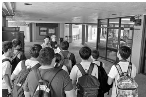
図3：ガイダンス後の施設見学

され、最終プログラムであるクロージングセレモニーまで、5日間の短期の研修プログラムであったが、プログラム内容が非常に充実しており、私も学生達もあつという間の研修であった。多くの日本の大学と交流のあるハワイ大学KRSであるが、その多くはアスレチックトレーナー研修を目的としたものであり、今回私たちが参加したプログラムは、講義の聴講、実技授業への参加、教員養成プログラムやトレーナー業務の見学、NCAA大学スポーツの観戦、学生生活における課外活動参加など、本学科が実施したKRSの学生として1週間の授業を体験するプログラムは日本の大学では初めて試みるプログラムであった。(図3)