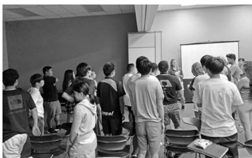
図4：授業風景1 (Emergency Care and First Aid)

授業の聴講やKRS学生による活動の見学では、KRS学生の授業に対する真摯な態度、関連な意見交換、教員のきめ細やかな指導、授業後にも関わらず列をなして教員とコミュニケーションをとる姿などを目の当たりにし、研修参加学生達も非常に刺激になり、学生自身も本研修初日から比べ、積極的な行動をとるようになっていた。(図4) その変化を表す理由として、学生達には毎日就寝までに、1日の研修内容を振り返ってもらう為の日誌を義務づけていたが、その内容が初めは授業の驚きなどが多かったが、日を迫うにつれ、ポジティブな内容やハワイ大学の行事等に自身からチャレンジする機会の内容が多くなっていった。また、オープニングセレモニーではおどおどしながら英語での自己紹介を行っており、私としても英語のサポートを行うと伝えていたが、相談等もなく、消極的な姿が非常に目立った。しかしながら、クロージングセレモニーでは、スピーチ内容の相談を事前に私のところに来るものも多く、またある学生は、現地で友達となったKRS学生に英語のチェックをしてもらうなど積極的な行動を取り、全員が心のこもったスピーチを行うことができたと感じた。実技の授業は英語のみのコミュニケーションであったが、本学科の学生にとって得意分野でもあったので、初日から積極的な参加が見られた。(図5) 参加したどの実技授業も非常にテンポが良く、KRS教員のきめ細やかな指導に、私の今後の授業にも参考になることが多かった。また、KRSの学生も誰一人手を抜かず一生懸命に参加しており、特に印象に残っているのは、ウエイトトレーニングの授業で、KRSの学生が自身のウエイトの限界に挑戦する姿を誰一人からかうこともなく、達成できた後に自然な拍手やハイタッチをする姿があったのは日本の大学の実技ではなかなか見られないものではないかと考える。