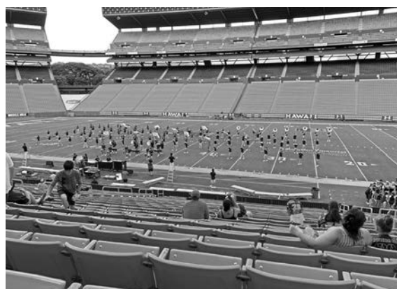
図10：高校マーチングバンド@ Aloha Stadium

積極的な態度、行動にはとても良い方向で、目を見張るものがあつた。また他人への配慮に関しても、よく気づく様になり、最終日前日のミーティングにおいて、プログラム中多大なるお世話をいただいたハワイ大学の先生