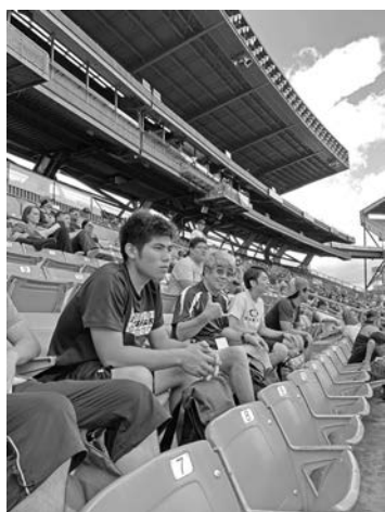
図9：アメリカンフットボールゲーム観戦@ Aloha Stadium